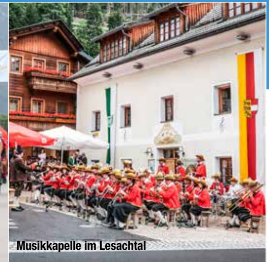
Musikkapelle im Lesachtal