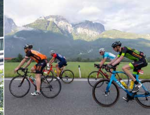
Mit dem alten Waffnenrad um die Lienzer Dolomiten